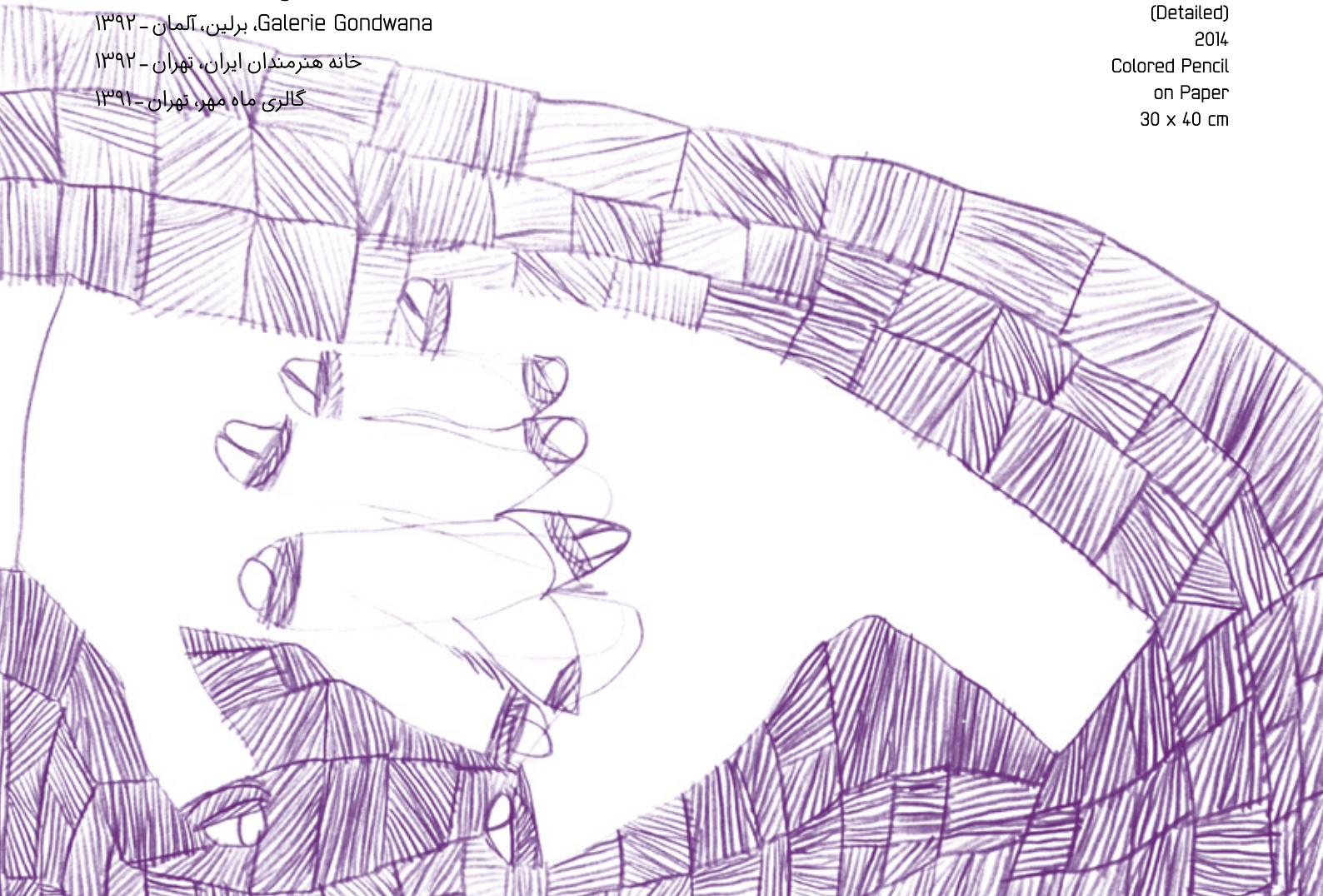
> بدون عنوان (صفحه‌ی قبل) Untitled 2014 Colored Pencil on Paper 30 x 40 cm بدون عنوان (بخشی از اثر) Untitled (Detailed) 2014 Colored Pencil on Paper 30 x 40 cm