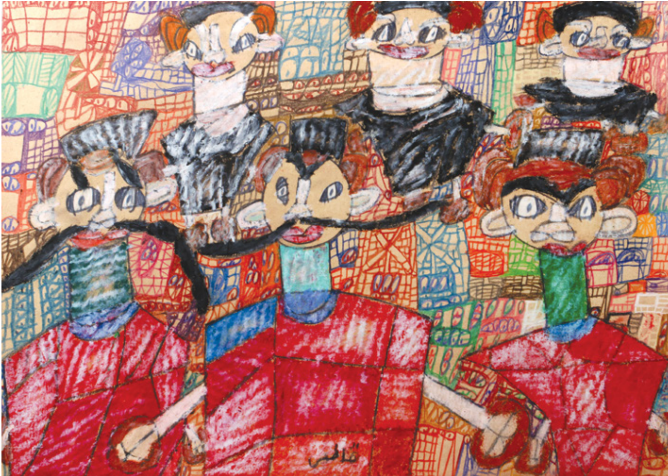
بدون عنوان (روی جلد) (بخشی از آثاری) Untitled (Detailed) 2014 Colored Pencil on Paper 40 x 30 cm بدون عنوان Untitled 2014 Colored Pencil on Paper 30 x 40 cm بدون عنوان Untitled 2014 Colored Pencil on Paper 30 x 40 cm