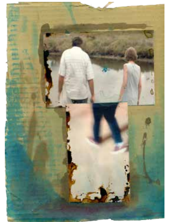
بدون عنوان كلاز Untitled 2014 - 2015 Collage 28 x 23 cm