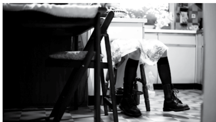
بدون عنوان ویدئو Untitled 2014 Video