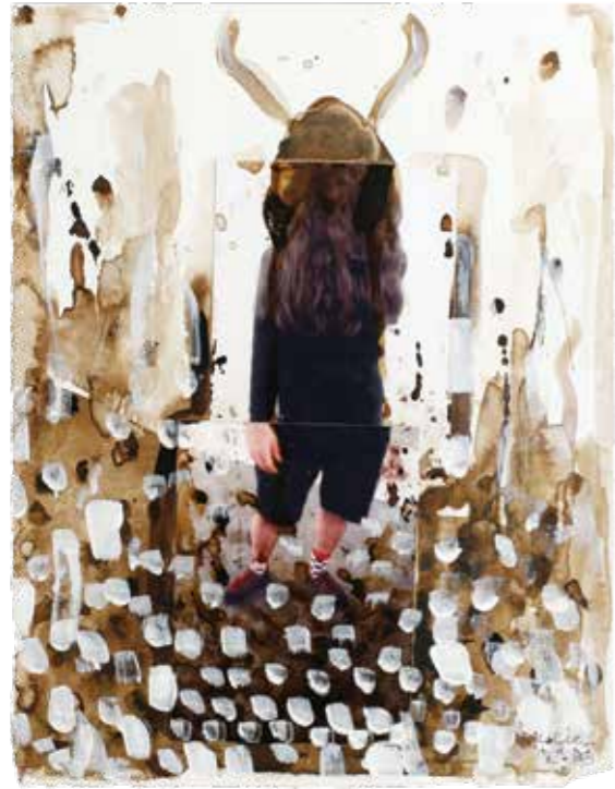
بدون عنوان كلاز Untitled 2014 - 2015 Collage 30 x 25 cm