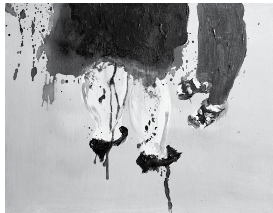
بدون عنوان اکریلیک روی بوم Untitled 2015 Acrylic on Canvas 35 x 45 cm

این کاتالوگ به مناسبت نمایشگاه پویا پارسامقام در مرداد نود و چهار در زیرزمین‌دستان منتشر شده است. متن نمایشگاه: پویا پارسامقام ناشر: زیرزمین‌دستان هماهنگ‌کننده: نینا عبادی عکاسی از آثار: محسن شاهمردی اجرای صفحه‌آرایی: هوداد مسلمی‌نژاد / استودیو کارگاه مدیر هنری و طراح: آریا کسایی / استودیو کارگاه