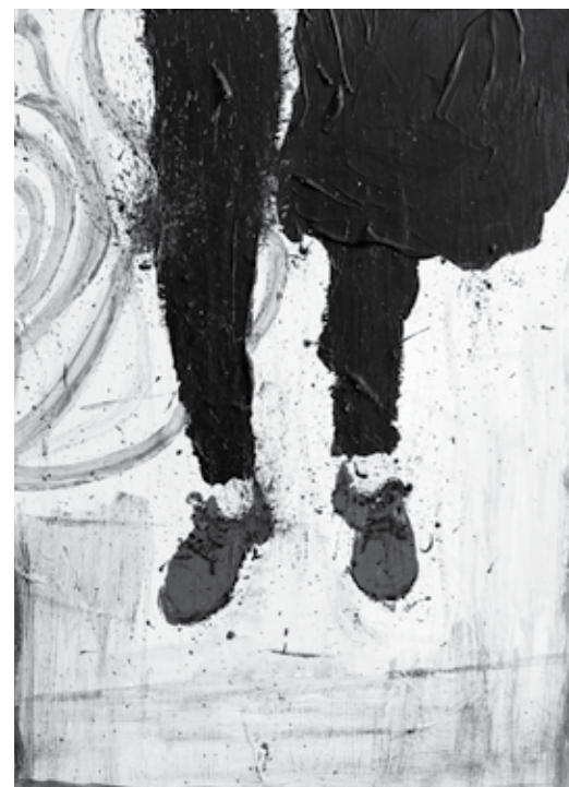
بدون عنوان اکریلیک روی بوم Untitled 2015 Acrylic on Canvas 25 x 35 cm