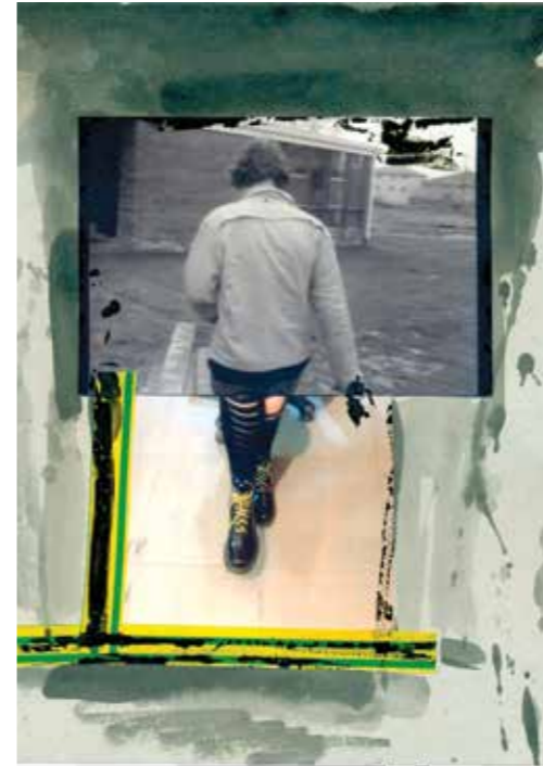
بدون عنوان كلاز Untitled 2014 - 2015 Collage 30 x 20 cm