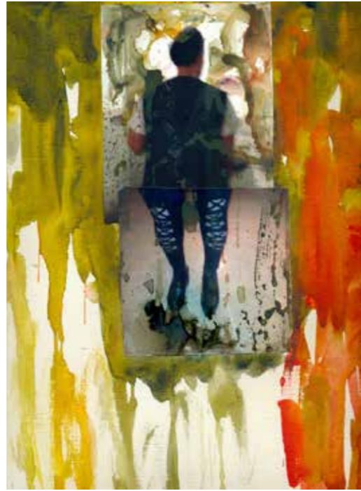
بدون عنوان كلاز Untitled 2014 - 2015 Collage 30 x 26 cm