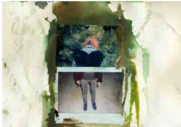
بدون عنوان كلاز Untitled 2014 - 2015 Collage 20 x 30 cm