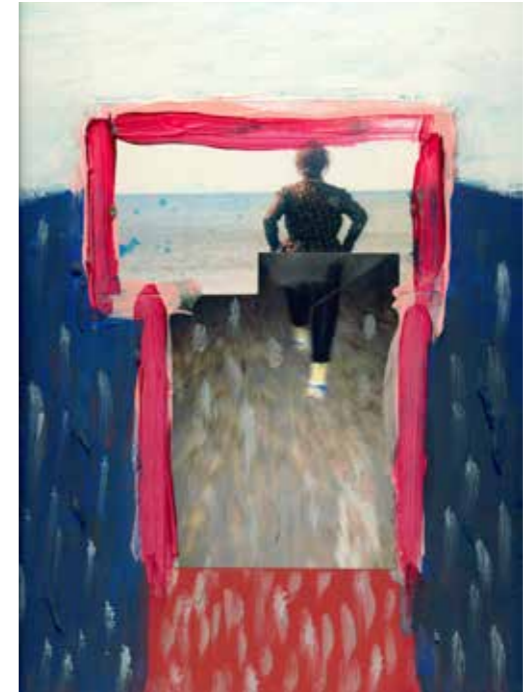
بدون عنوان كلاز Untitled 2014 - 2015 Collage 30 x 25 cm