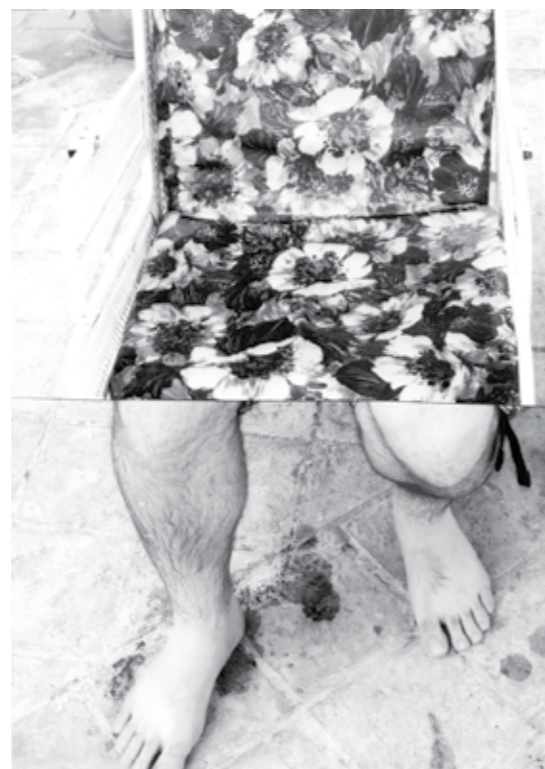
بدون عنوان کلاژ عکس Untitled 2014 - 2015 Photo Collage 10 x 8 cm