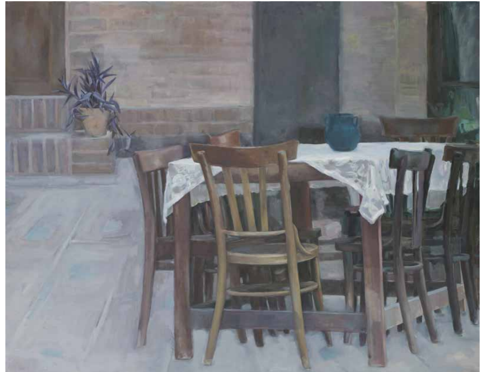
بدون عنوان رنگ روغن روی بوم Untitled Oil on Canvas 2015 130 x 165 cm