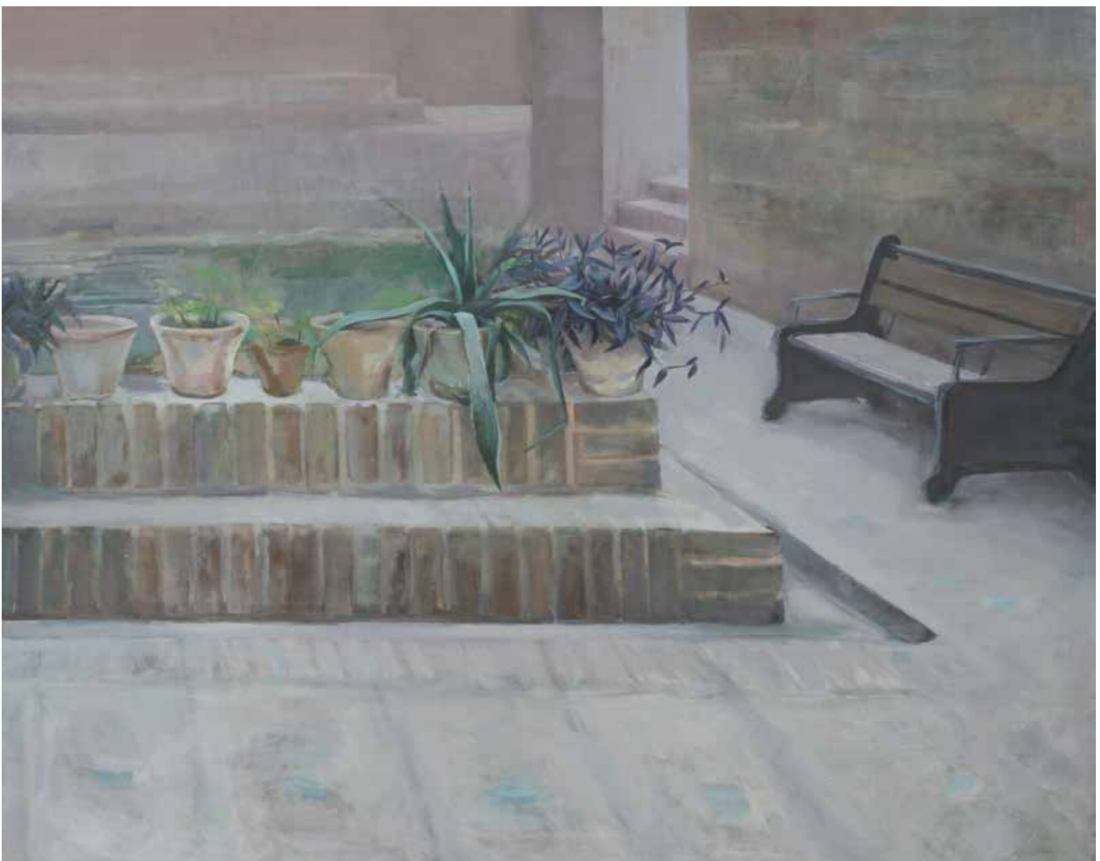
• (جغتی از اثر) • بدون عنوان رنگ روغن روی بوم (Detail) Untitled Oil on Canvas 2015 130 x 165 cm • بدون عنوان رنگ روغن روی بوم Untitled Oil on Canvas 2015 165 x 130 cm