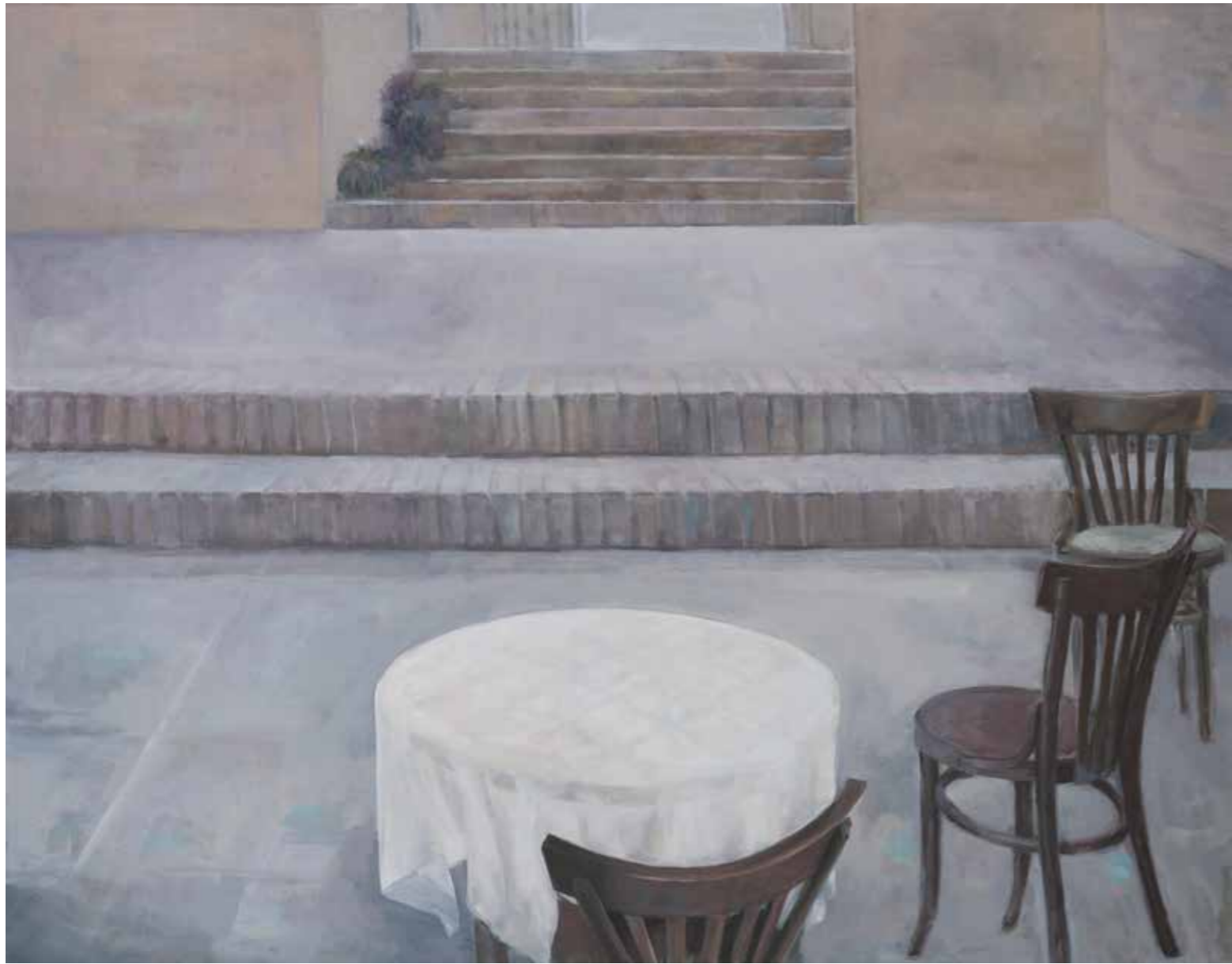
بدون عنوان رنگ روغن روی بوم Untitled Oil on Canvas 2015 130 x 165 cm